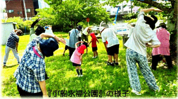
『小船永福公園』の様子

橋北地区と前羽地区では計10か所でラジオ体操を実施しています。 体操の主催は自治会や老人会が担っているため、お年寄りから子供まで、誰でも参加可能です！